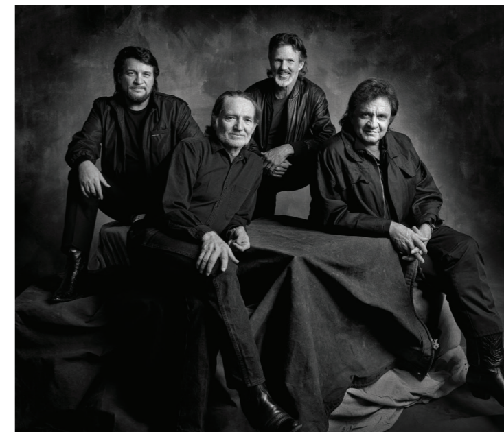
The Highwaymen (de gauche à droite) : Waylon Jennings, Willie Nelson, Kris Kristofferson et Johnny Cash !

Kris Kristofferson continue à être reconnu pour son travail. Il a de nouveaux projets. Sa collaboration avec Willie Nelson, Dolly Parton et Brenda Lee pour l'album « The Winning Hand » atteint le sommet des charts country